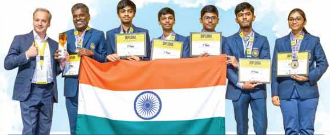
WORLD SCHOOLS TEAM CHESS CHAMPIONS