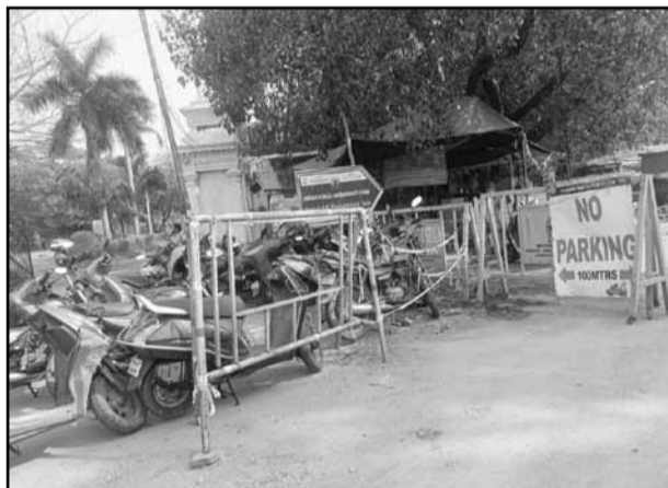
As the number of people booking tickets continues

to increase at the Chennai Egmore railway station, parking of vehicles has been banned at the station. A no-parking sign has also been put up. As a result, people do not park their vehicles there and park wherever there is space nearby. It is very disruptive to the general public. Therefore, we request the concerned department to take appropriate action in this regard.