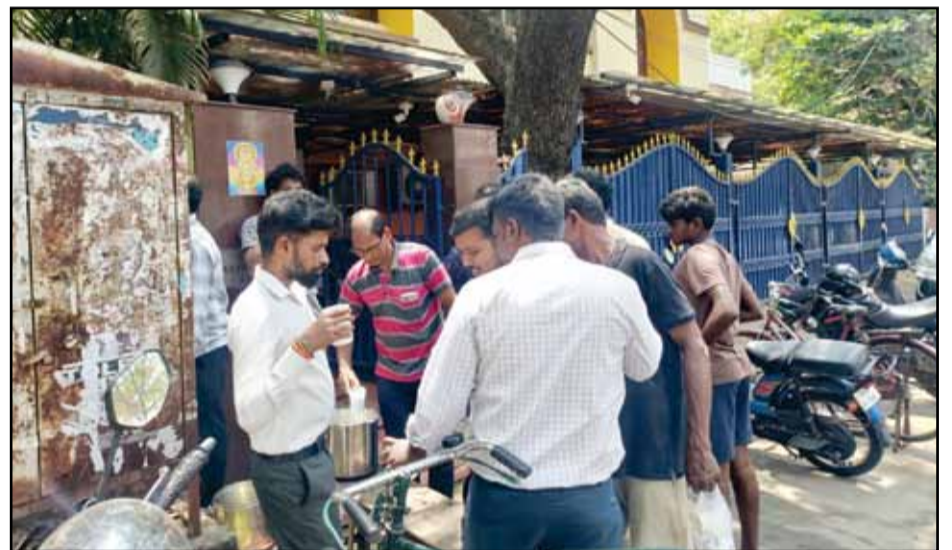
In Anna Nagar ab block 44 free buttermilk was given to the general public passing by due to high heat exposure. People enjoyed drinking to quench their thirst. Elderly, and children are advised to drink more water and stay hydrated in this summer season.