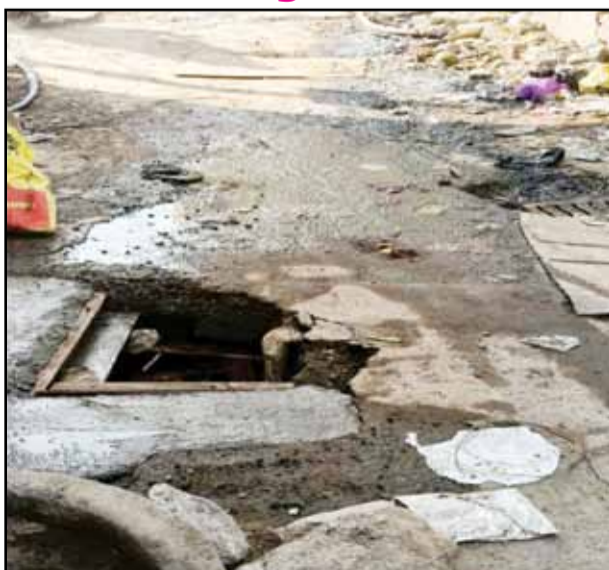
Metro work was going on near the Kilpauk Poetry and Grammar shop for a few days. They took it and

now they have opened drainage there and conducted work. They did not close it properly and kept it closed with just a board. Another is to leave the drainage without covering it with any device. Due to this, the residents living there have to be very safe. More than 35 houses are found in the area. Passing public and students and children will face accidents. So the people of the area are requesting the Chennai Municipal Corporation to close it properly.