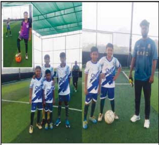
Your kids Learn a professional foot ball.. then choose us. We are successfully running 5 years @ No: 128, Norton Essbee Tower, Bricklin Road, Purasaiwalkam,