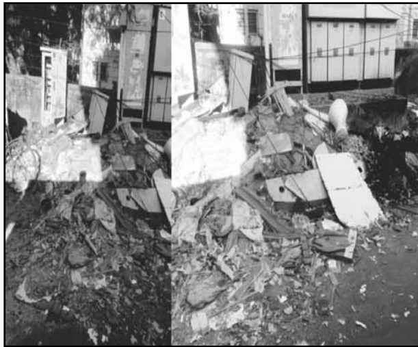
House wastes and construction wastes like doors

are being disposed near the electricity pole and transformers in W Block 1st street in Anna Nagar. This not only poses danger for the people disposing the garbage but also the ones involved in removing these garbages. Careless disposal from the public is the root cause behind this. The corporation must also take steps to install dustbins in the vicinity. This might bring the behavioral change among the people.