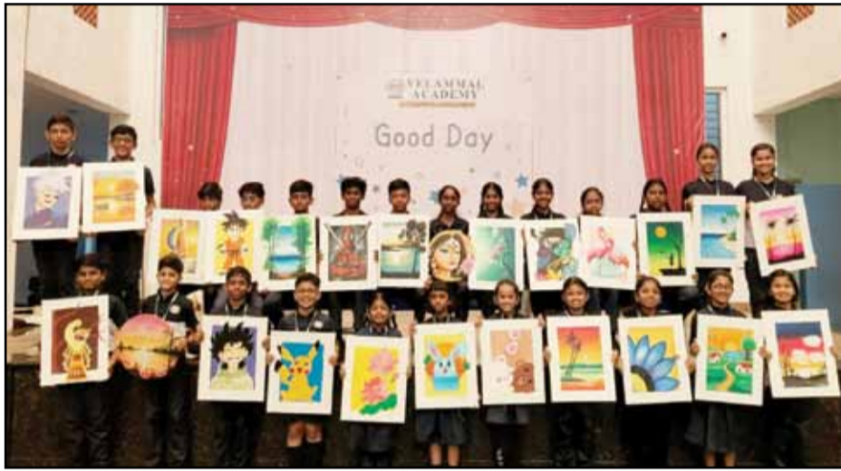
The school assembly of Velammal Academy Nolambur came alive with creativity and color as students celebrated *World Art Day* with great enthusiasm on Apr 15th 2026.