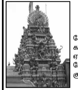
உடன் பிறந்த கர்மத்தை விட்டுவிடலாகாது!

குந்தியின் மைந்தா, கேடுடையதெனினும் உடன் பிறந்த கர்மத்தை விட்டுவிடலாகாது. ஏனென்றால் தீயைப் புகை சூழ்வது போன்று அனைகளையெல்லாம் கேடு சூழ்ந்துள்ளது. ஸ்ரீமத் பகவத்கீதை - அத் - 18:48 கேடு இல்லாத கர்மம் இப்பிரபஞ்சத்தில் இல்லை. சுவாசிக்கின்றோம்; அதனால் காற்றில் உள்ள அணு போன்ற உயிர்கள் மடிக்கின்றன. ஆக தீங்கு இல்லாத கர்மம் இயற்கையில் இல்லை. காலத்திற்கும் இடத்திற்கும், சந்தர்ப்பத்துக்கும் ஏற்றவாறு ஒரு வினையில் அமைந்துள்ள நலமோ கேடோ மாறுபாடு அடைகிறது. இவைகளையெல்லாம் தூக்கி வினை செய்கிறார்கள். யோகியின் இயல்பு மிக உயர்ந்தது. தனக்கு அமைந்த கடமையை அவன் தேவ ஆராதனையாகச் செய்கிறான்.