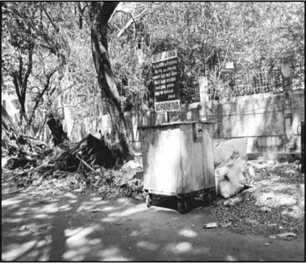
Tree wastes like broken branches and leaves and

heaps of sand and small rocks are found in the sides of Tagore circle road in Belly area of Anna nagar. These wastes are found making their way into the road. The pedestrians are finding it difficult to walk through the zone. The dustbin in the vicinity is found lying idle. Frequent inspection from the corporation is needed to avoid problems for the commuters who walk through the side walks on routine basis.